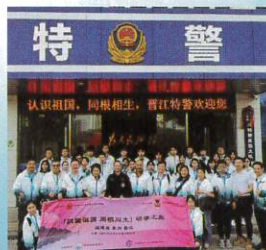
本次活動由香港內地青年義工交流協會、油尖旺民政事務處、天主教鳴遠中學、培椅愛國教育社及中國教育交流（香港）中心共同舉辦